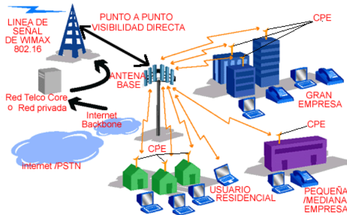
Gráfico de las aplicaciones de WiMAX de 1ª generación:

La segunda generación de WiMAX será para interiores, con módems autoinstalables similares a los de xDSL. A partir de ese momento WiMAX ofrecerá movilidad a los usuarios para que puedan desplazarse sin perder la conexión.